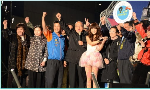
圖說：臺中市長胡自強、新一代網路女神大元與亞洲大學師生一同亮麗展現。